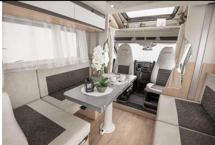
POGLED NA KUHINJU I DNEVNI BORAVAK