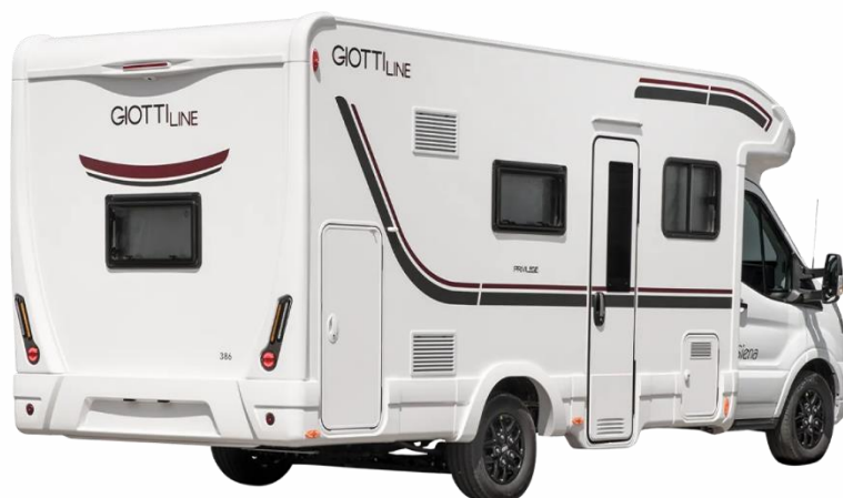
Slike su informativnog karaktera